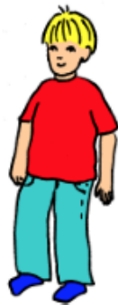
Dra upp byxor