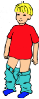
Dra ner byxor