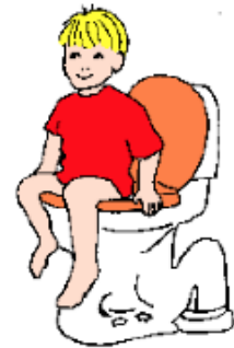
Sätt dig på toa