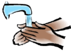
Skölj bort tvålen